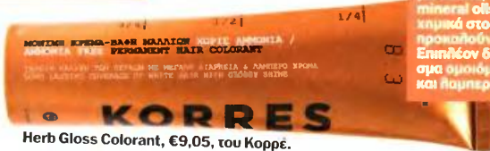
Herb Gloss Colorant, €9,05, του Korré.

HAIR GLOW Δεν περιέχει αμμωνία, parabens, silicones, mineral oils και άλλα χημικά στοιχεία που προκαλούν αλλεργίες. Επιπλέον δίνει αποτέλεσμα ομορφότερο και λαμπερό.