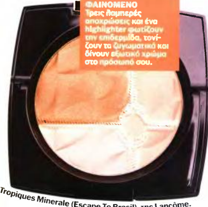
Tropiques Minerale (Escape To Brasil), της Lancôme.

ΤΡΟΠΙΚΟ ΦΑΙΝΟΜΕΝΟ Τρεις λαμπερές αποχρώσεις και ένα highlighter φωτίζουν την επιδερμίδα, τονίζουν τα χαρακτηριστικά και δίνουν βελούδινο κρέμα στο πρόσωπό σου.