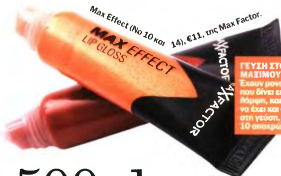
Max Effect (No 10 και 14), €11, της Max Factor.

ΓΕΥΣΗ ΣΤΟ ΜΑΞΙΜΟΥΜ Έχουν μοναδική σύνθεση, που δίνει αισθηματική λάμψη, και επιπλέον καθένα έχει και από μια ευχάριστη γεύση. Θα τα ήξεις σε 10 αποχρώσεις.