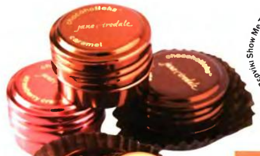
Show Me The Rings, €10, της Essie.

ΕΘΙΣΜΕΝΗ ΣΤΗ ΣΟΚΟΛΑΤΑ Τρόφιμα, σοκολάτα, κρέμα φρούτων, σοκολάτα-πορτοκάλι. Είναι τα πιο νόστιμα lip gloss, που θα σου ανοίξουν την όρεξη.