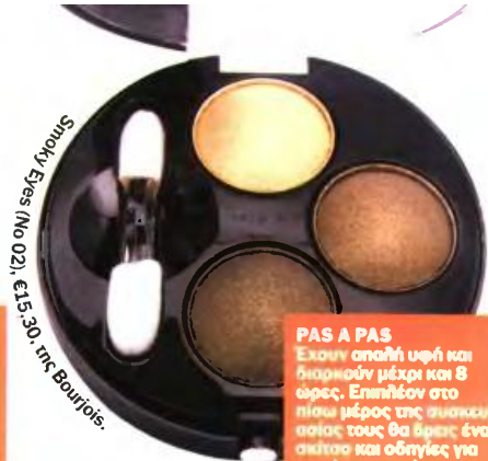
Smoky Eyes (No 02), €15-30, της Bourjois.

ΓΕΥΣΗ ΣΤΟ ΜΑΞΙΜΟΥΜ Έχουν μοναδική σύνθεση, που δίνει αισθηματική λάμψη, και επιπλέον καθένα έχει και από μια ευχάριστη γεύση. Θα τα ήξεις σε 10 αποχρώσεις.