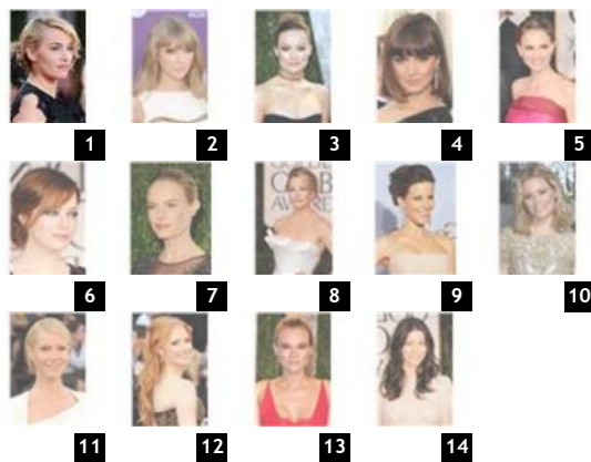
Η Kate Winslet στις Χρυσές Σφαίρες 2012.

Τα nude κραγιόν πηγαίνουν σε όλες, ιδιαίτερα αν κάνουν μακιγιάζ με smoky eyes. Δεν δεσμεύονται ούτε από το χρώμα των μαλλιών ούτε από τα ρούχα. Το αποτέλεσμα πρέπει να δείχνει φυσικό, να αναδεικνύει την ομορφιά των χειλιών και η απόχρωση να μη χλωμαίνει.