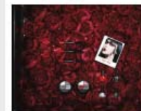
Sephora μου, Sephora μου!