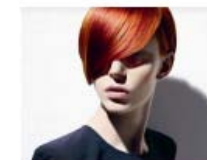
Μαλλιά για το 2010