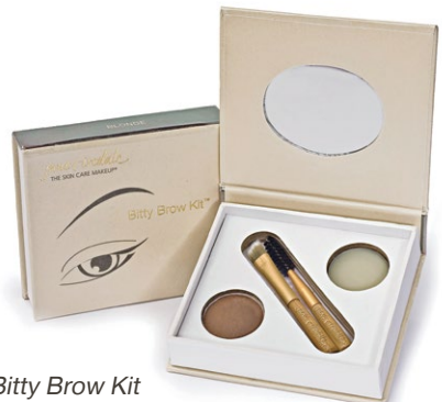
Bitty Brow Kit

Η επιδερμίδα το καλοκαίρι ιδρώνει, οι πόροι διαστέλλονται από τη ζέστη και το τελευταίο πράγμα που θέλουμε είναι μια βάση που θα αλλοιωθεί και θα δείξει «βαριά». Από τη σειρά της jane iredale προτείνω την κρέμα CC Dream Tint® SPF 15 γιατί θα δώσει όση κάλυψη χρειάζεται ένα δέρμα το καλοκαίρι και δε θα επιβαρύνει την υφή. Αντίθετα, επειδή η σύνθεση είναι oil free και ενυδατική θα δώσει ακόμη περισσότερη διάρκεια στο μακιγιάζ σας. Μου αρέσει η απόχρωση Warm Bronze που ζεσταίνει την επιδερμίδα, καθώς και η Peach Brightener που εξουδετερώνει τις δυσχρωμίες και τους γκρι ή λαδί τόνους που μπορεί να υπερισχύουν.